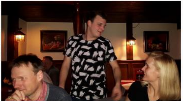
2017-01-07: Hallenturnier Glücksburg 3.Platz