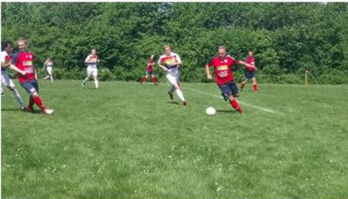
2017 Saisonabschluss TSBIII-DGFIII (5:3)