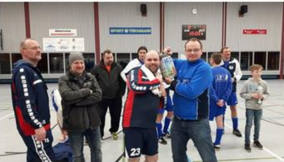
2017-05-28 Roter SternII-TSBII (3:3)